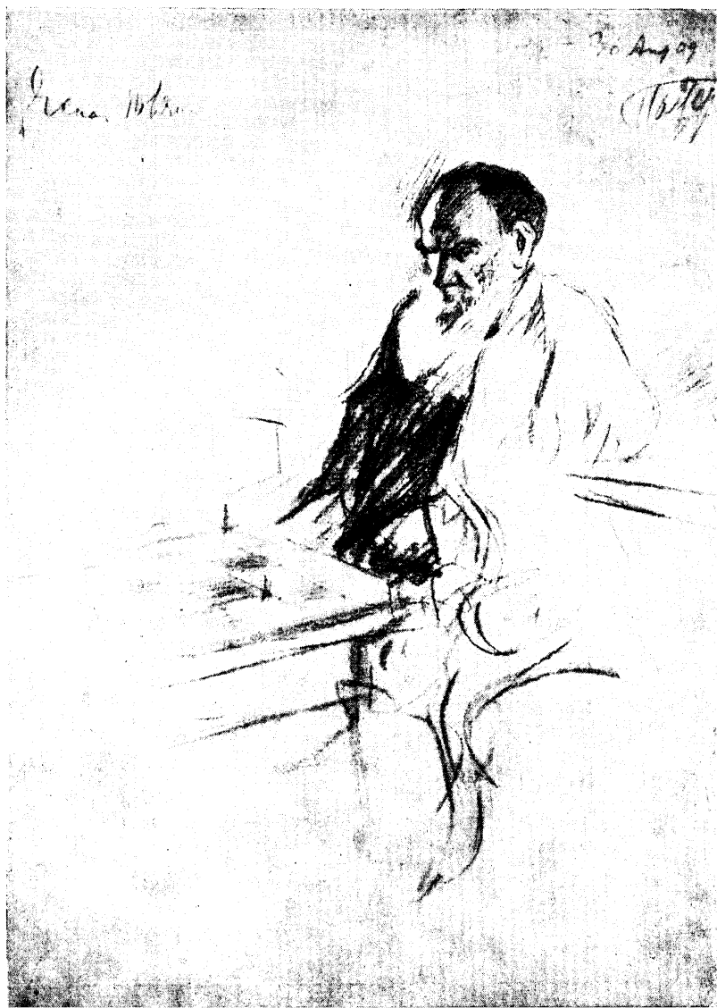
ТОЛСТОЙ ЗА ШАХМАТАМИ Рисунок Л. О. Пастернака