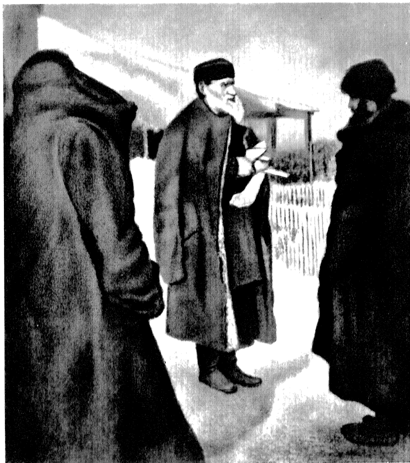
Л. Н. Толстой в Бегичевке. Фотография 1892 г.