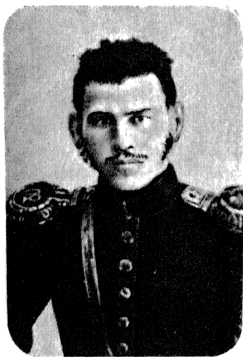
Л. Н. ТОЛСТОЙ 1851 [?] г.