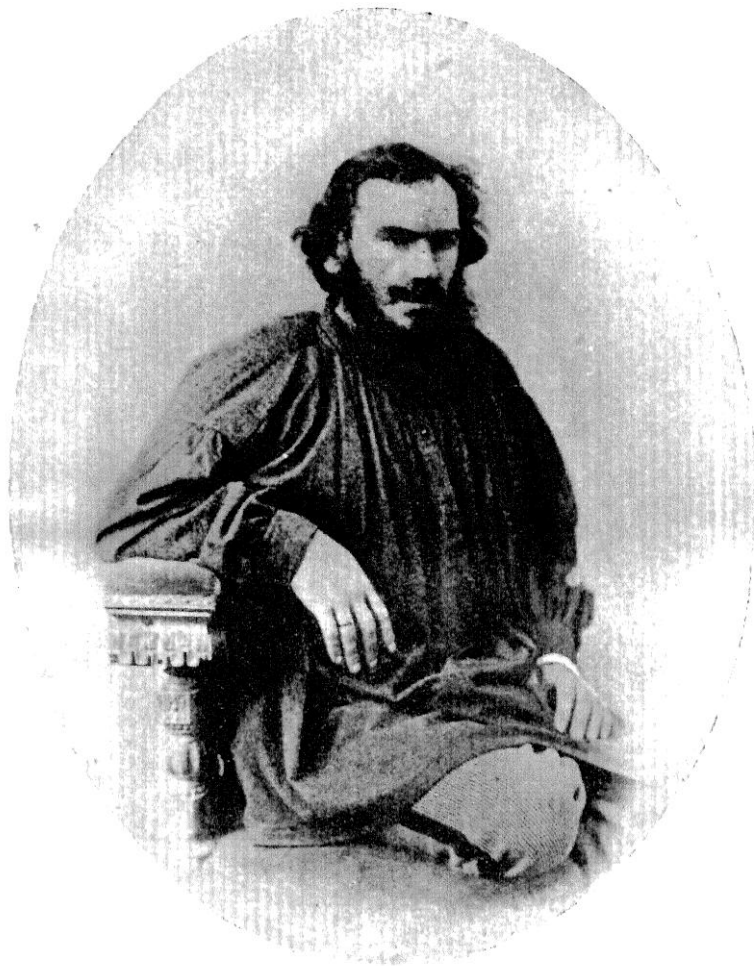
Л. Н. ТОЛСТОЙ 1868 г.