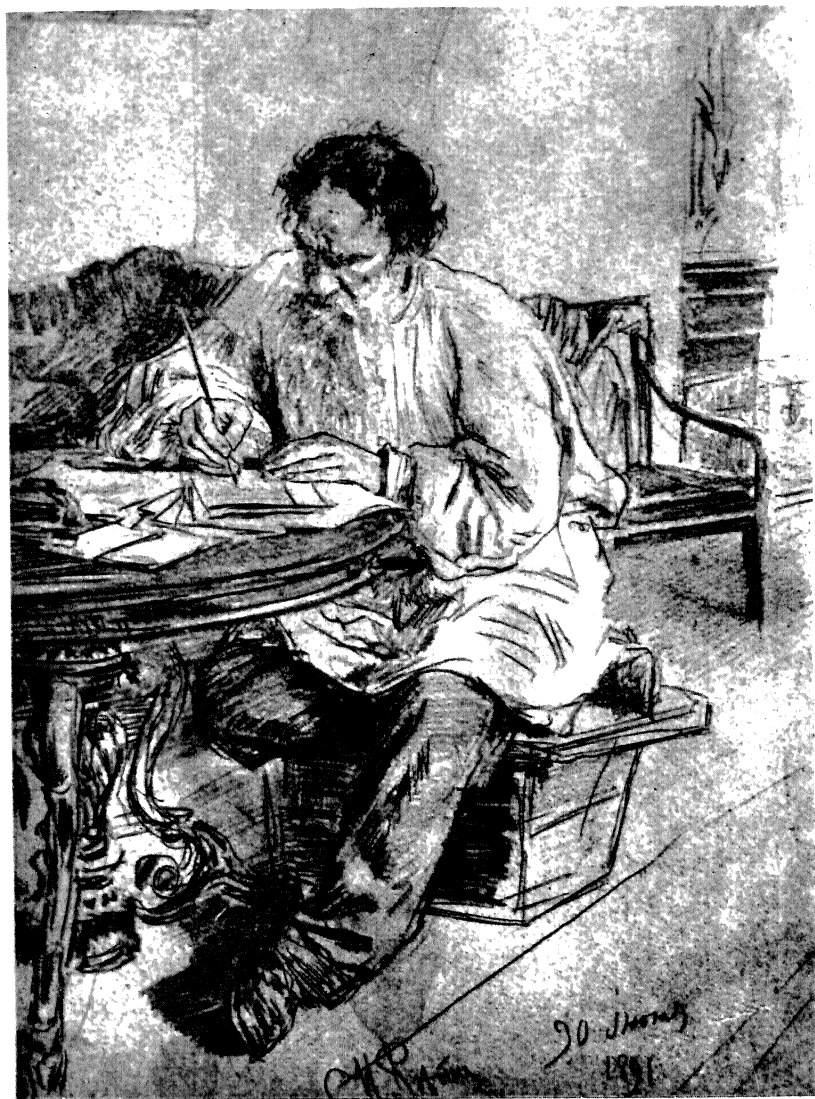
Л. Н. ТОЛСТОЙ