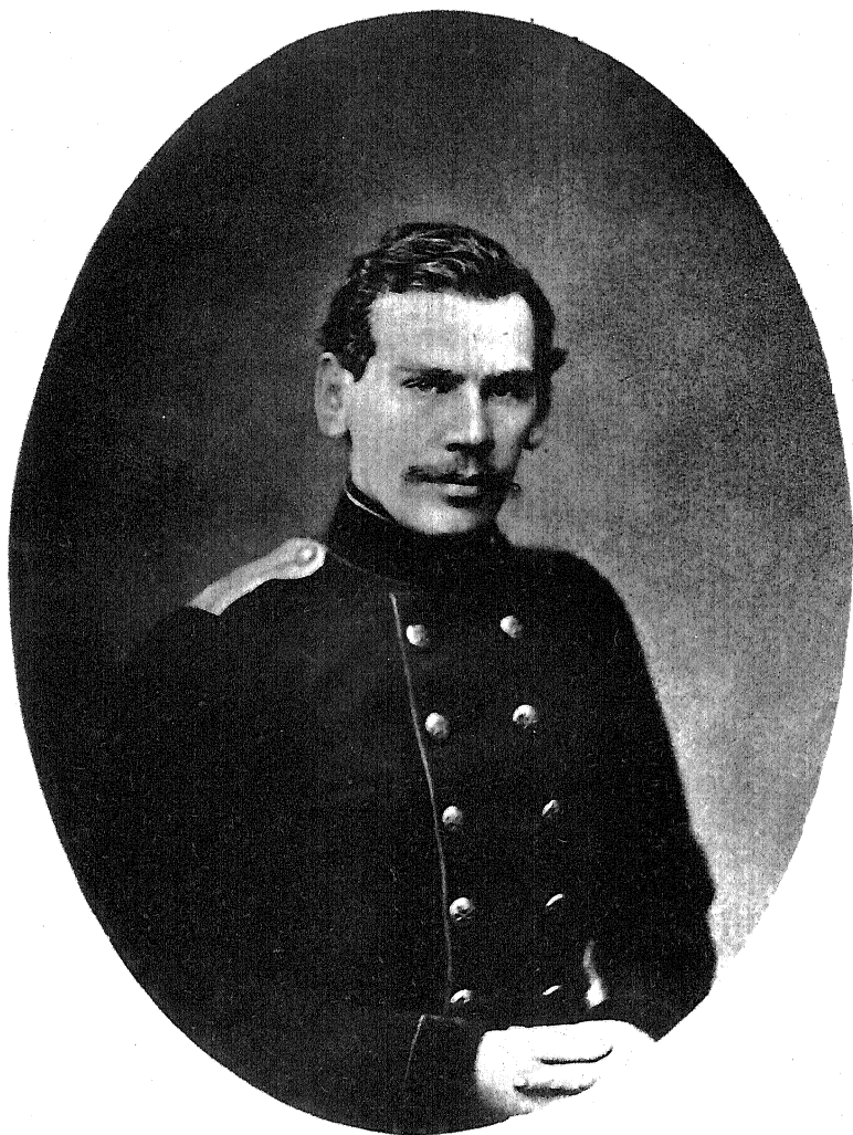
Л. Н. ТОЛСТОЙ 1856 г.