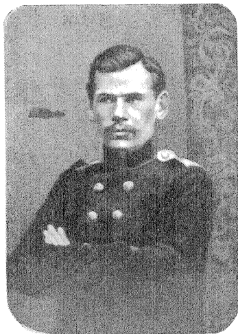
Л. Н. ТОЛСТОЙ март 1856 г.